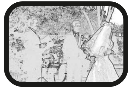
9) ALEJAR ZOOM: En el altar