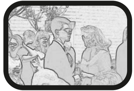
15) ACERCAR ZOOM: Gafas de sol