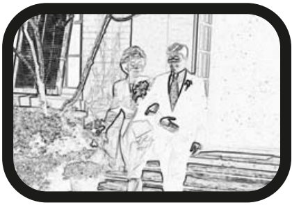
7) ACERCAR ZOOM: El padrino con la madre