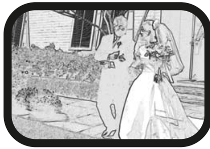
8) ACERCAR ZOOM: El padre con la novia