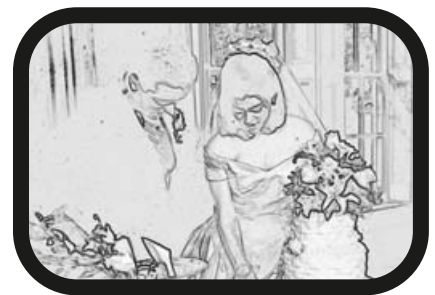
12) ACERCAR ZOOM: Cortando la tarta