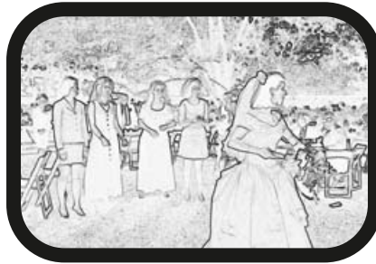
17) ALEJAR ZOOM: Lanzando el ramo