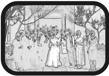
19) ALEJAR ZOOM: Foto en grupo