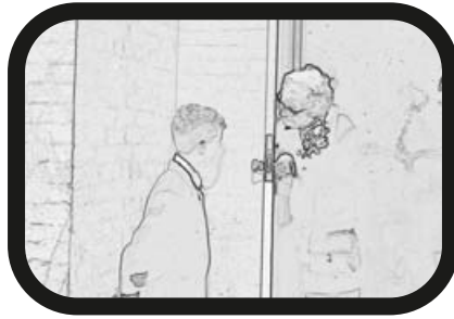
5) ACERCAR ZOOM: Consejos de la abuela