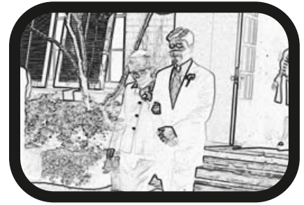
6) ACERCAR ZOOM: El padrino con la abuela