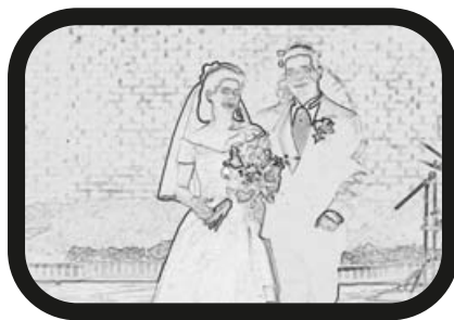
11) ALEJAR ZOOM: Los novios