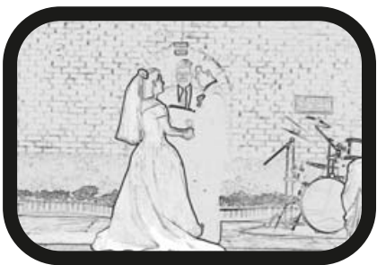
10) ACERCAR ZOOM: Los votos