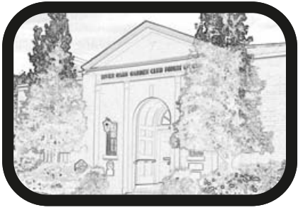
1) ACERCAR ZOOM: Recepción de la boda