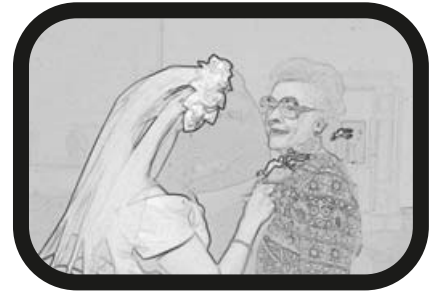
3) ACERCAR ZOOM: Últimos preparativos