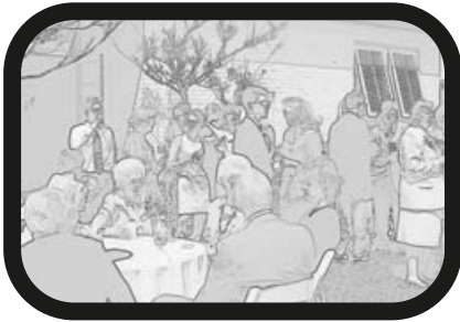
16) ALEJAR ZOOM: Celebración