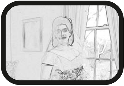
4) ALEJAR ZOOM: La novia