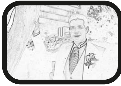
2) ACERCAR ZOOM: El novio