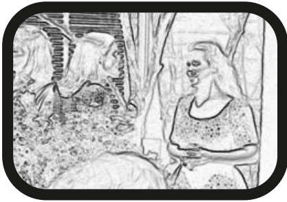
13) ACERCAR ZOOM: Invitados conversando