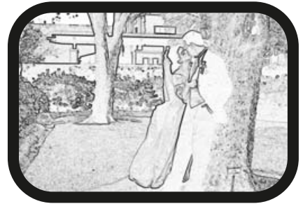
18) ACERCAR ZOOM: El beso