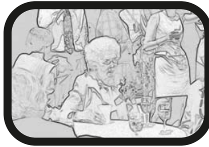
14) ACERCAR ZOOM: La abuela